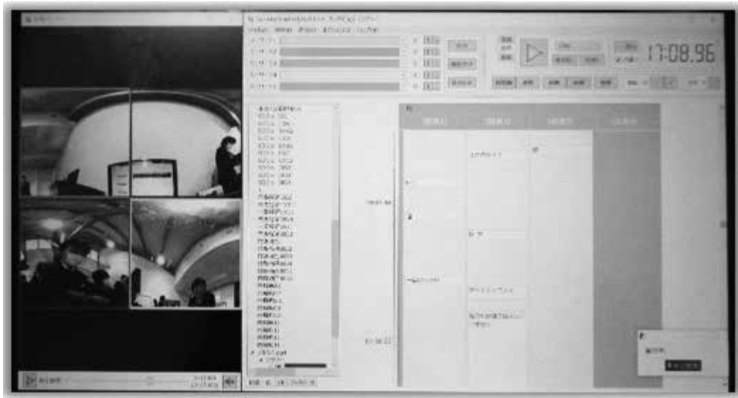
図3：学戦システム 見つける君3 (Conversation Analyzer 3.0) による発話書き起こしと同期した音声、ビデオ再生の画面イメージ

スト化の精度は70%程度であるが、テキスト化の精度が不十分でも、テキストをインデックス的に利用して確かめたい場面に大まかなあたりをつけられれば、あとは実際の音声聞いて確かめることができる。テキストの修正も可能だ。また、キーワード検索機能(図4)は、任意のキーワードを入力すると、そのキーワードを含む発話のマスに色がつく仕組みになっている。キーワードはコンテンツ用語だけでなく、「なんで?」「どういうこと?」