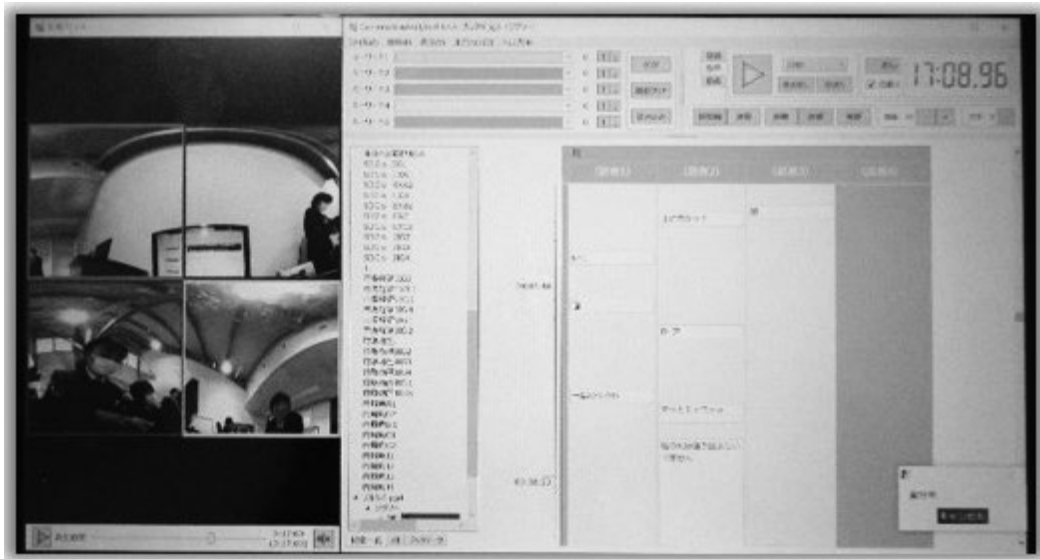
図3：学戦システム 見つける君3 (Conversation Analyzer 3.0) による発話書き起こしと同期した音声、ビデオ再生の画面イメージ

スト化の精度は70%程度であるが、テキスト化の精度が不十分でも、テキストをインデックス的に利用して確かめたい場面に大まかなあたりをつけられれば、あとは実際の音声聞いて確かめることができる。テキストの修正も可能だ。また、キーワード検索機能(図4)は、任意のキーワードを入力すると、そのキーワードを含む発話のマスに色がつく仕組みになっている。キーワードはコンテンツ用語だけでなく、「なんで?」「どういうこと?」