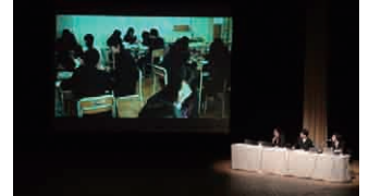
ビデオによる授業実践の解説の様子 (平成23年度報告会)